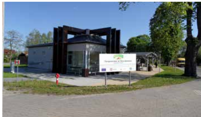
Infrastruktura targowiska w Sierakowie w powiecie międzychodzkiem.

1. Gmina Krzyż Wielkopolski, 2. Gmina Margonin, 3. Gmina Sieraków, 4. Gmina Rogoźno, 5. Gmina Zbąszyń, 6. Gmina Tarnowo Podgórne, 7. Gmina Pobiedziska, 8. Miasto i Gmina Trzemeszno, 9. Gmina Mosina, 10. Gmina Czempień, 11. Gmina Środa Wielkopolska, 12. Gmina Nekla, 13. Gmina Zagórów, 14. Gmina Pleszew, 15. Gmina Gołuchów, 16. Gmina Lisków, 17. Gmina Koźminek, 18. Gmina i Miasto Ostrzeszów.