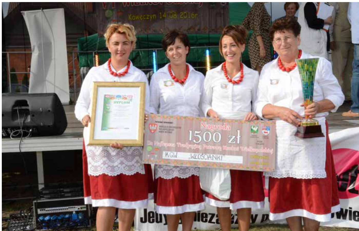
„Włościanki” z nagrodami za najlepszą potrawę VI Festiwalu Tradycyjnej Kuchni Wielkopolskiej 2016 w Kawęczynie.

Popularność w całym regionie zyskały w 2015 roku, zwyciężając w plebiscycie Głosu Wielkopolskiego na najlepsze Wielkopolskie Koło Gospodyń Wiejskich. Ten zaszczytny laur zainspirował władarzy powiatu pilskiego do namówienia „Włościanek”, aby reprezentowały swój powiat podczas festiwalu kulinarnego w Kawęczynie w 2016 roku. Decyzja ta okazała się być strzałem w dziesiątkę. Panie z koła poza wspianą roladą wołową specjalizują się również w słodkościach. Każdy kto odwiedzi Białośliwie z pewnością dowie się, że najlepsze powidła wychodzą właśnie „Włościankom”. Panie przygotowują swój przysmak według receptur przekazywanych od pokoleń. Proces gotowania powideł odbywa się na świeżym powietrzu. Gotuje się je w kuprowym kotle, a do mieszania używa tzw. „bociana”.