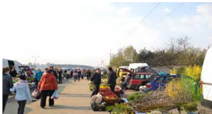
Targowisko gminne w Koźminku w powiecie kaliskim.

Aby uzyskać dofinansowanie, muszą być spełnione określone warunki: targowisko musi być ogólnodostępne, a co najmniej 30% jego powierzchni powinno zostać przeznaczone dla rolników pod sprzedaż produktów rolno-spożywczych. Przed złożeniem wniosku o płatność końcową, beneficjent musi zadbać o to, aby targowisko było utwardzone, oświetlone, przyłączone do sieci wodociągowej, kanalizacyjnej i elektroenergetycznej, wyposażone w odpływy wody deszczowej, zadaszenie na co najmniej połowie powierzchni handlowej, a także w miejsca parkingowe i urządzenia sanitarnohigieniczne. Targowisko powinno też być oznaczone nazwą „Mój Rynek” i unijnym logiem produkcji ekologicznej oraz zorganizowane tak, aby umożliwić rolnikom dostęp do punktów sprzedaży w sposób określony w regulaminie targowiska.