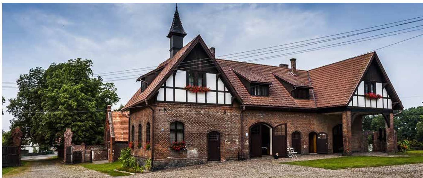
Folwark Wąsowo w gminie Kuślin (powiat nowotomyski) – zwycięzca konkursu w 2016 roku w kategorii „Obiekty na terenach wiejskich o charakterze np. terapeutycznym, edukacyjnym, rekreacyjnym, itp. wykorzystujące tradycje i walory wsi”.

W dziesięciu dotychczasowych edycjach konkursu udział wzięło około 480 gospodarstw, spośród których 94 zostały nagrodzone, a 53 wyróżnione.