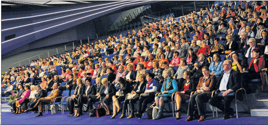
W konferencji wzięło udział około sześciuset gości.

Samorząd regionu podsumował współpracę z partnerami.