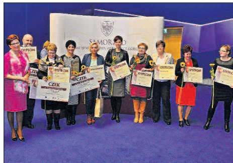
Podczas spotkania rozstrzygnięto konkurs „Sołtyska-Liderka”.